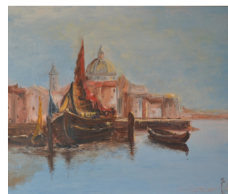
Koch, Venise , Collection particulière

Un voyage qui évoque l'histoire, l'histoire qui s'écrit en musique.