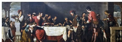
Bernardo STROZZI, Le repas chez Simon , 1630, Galleria dell'Academia, Venise

Création à La Fouly (VS – CH) le 28 juillet 2018